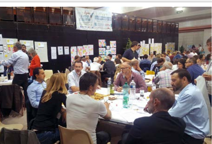
Forum Comobilité 2018.