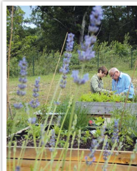
Atelier de « potaginage » éducatif pour les résidents d'un EHPAD.