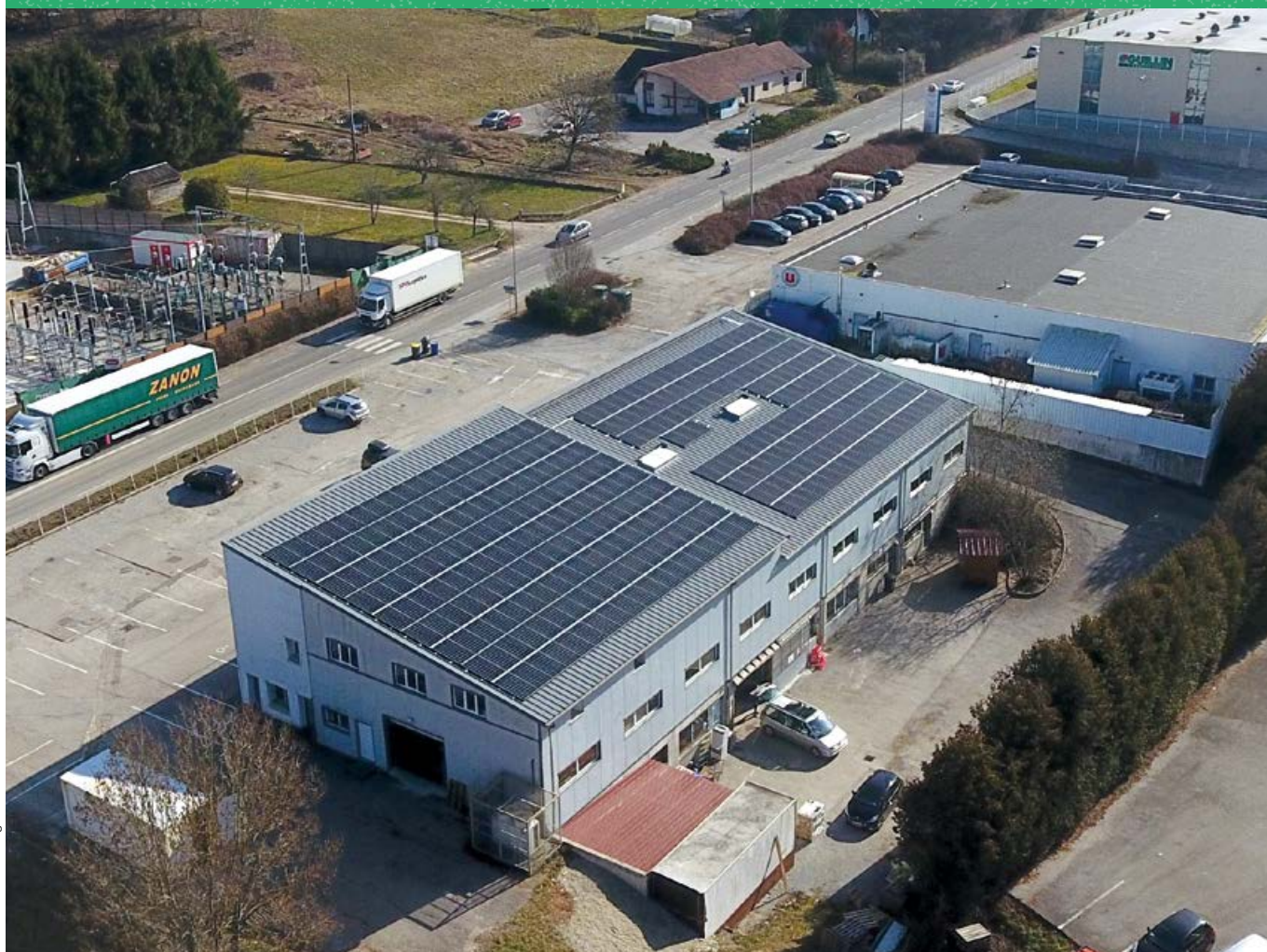
La Fruitière à Énergie. Centrale photovoltaïque de 99 kWc, en financement citoyen par la Fruitière à Énergies.

Pilier majeur de la transition écologique, la transition énergétique implique une transformation des modes de production et de consommation d'énergie et pose la question de la dépendance énergétique des territoires. Plusieurs acteurs de l'ESS œuvrent au développement des énergies durables (solaire, éolienne, etc.) et proposent la mise en œuvre de gouvernances citoyennes et locales pour des projets de production, de distribution et de consommation de ces énergies renouvelables.